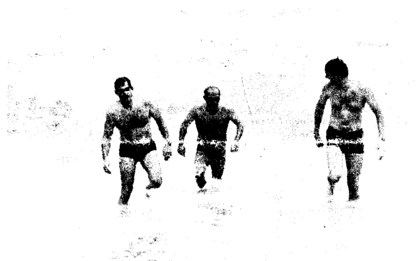
CURIOSA ACCION PACIFISTA. — En el Balneario Las Salinas, a mediodía de ayer, tres dirigentes del grupo "Meditación por la Paz" efectuaron un acto ceremonial para meditar por la paz mundial, nadando una milla en las heladas aguas del Pacífico. Las fotos muestran