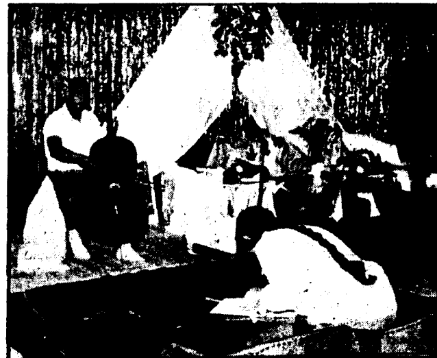
En el hotel viñamarino donde está hospedado el grupo pacifista internacional, Sri Chinmoy interpreta música oriental para las meditaciones de sus discípulos.

Y para conseguir esa meta, Chinmoy y sus seguidores están dispuestos a cual-