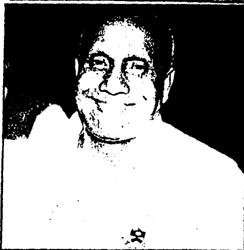
Sri Chinmoy, líder del Grupo de Meditación por la Paz que funciona en las Naciones Unidas.

Utilizando otra máquina especial, con la cual una persona estando sentada ejecuta levantamientos usando los músculos de las pantorrillas, Sri Chinmoy ha levantado objetos de hasta 1.000 kilos, incluyendo a un caballito con su dueño y una calabaza de 510 libras, la más grande cultivada en los alrededores de Nueva York este año.