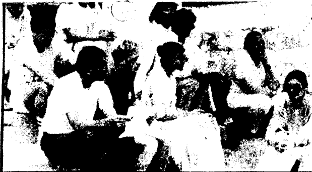
Numerosos funcionarios de las Naciones Unidas forman parte del grupo pacifista que acompaña a Sri Chinmoy a través del mundo.

regulares de distintos países. Con frecuencia entrecierra los ojos y se sume en una intensa meditación, buscando las más simples explicaciones para la mejor comprensión de quienes le escuchan.